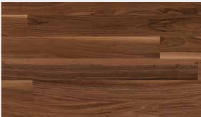
NARROW WALNUT SEMI MAT